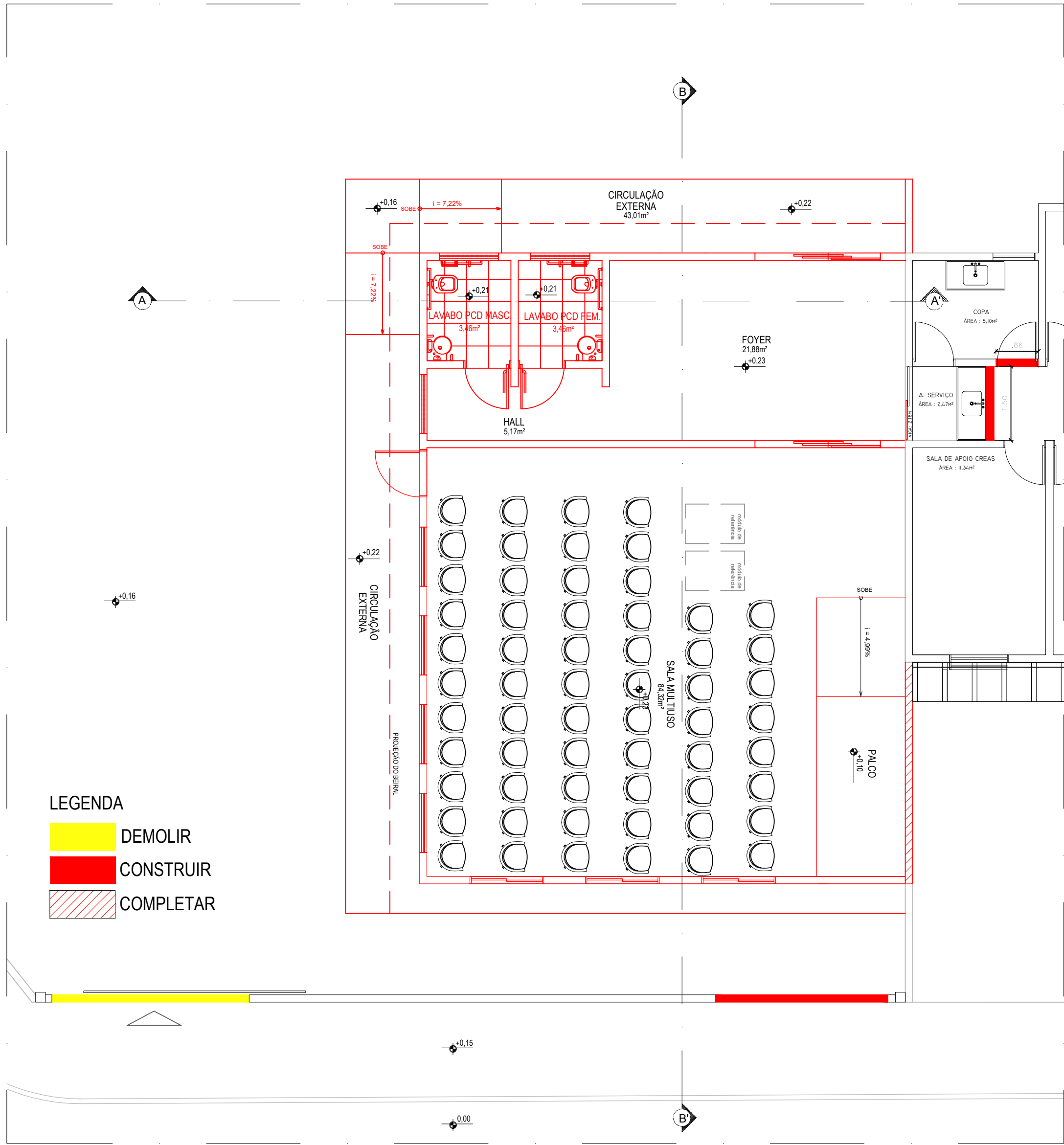
03 PLANTA DE REFORMA E AMPLIAÇÃO ESCALA 1:75