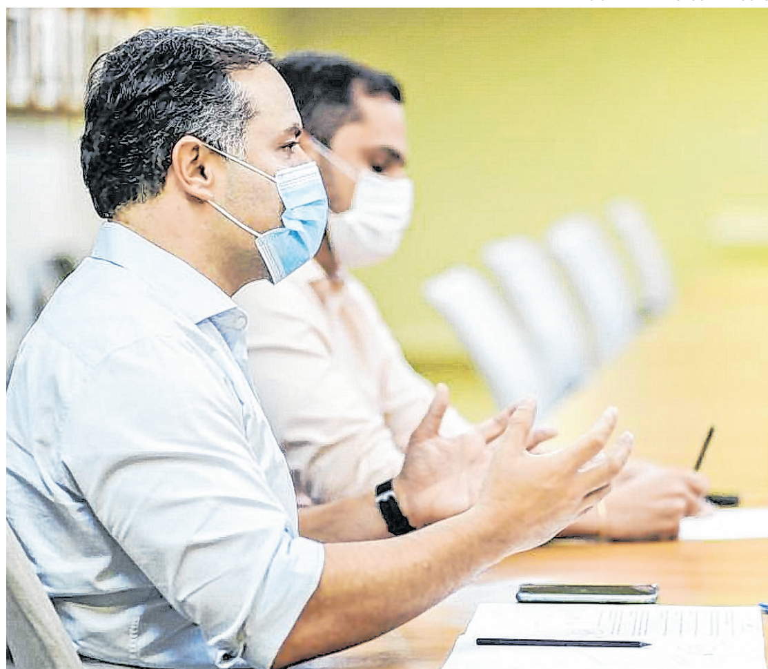
Governador de Alagoas renova decreto e mantém estado na Fase Amarela do distanciamento social

Confira as últimas flexibilizações na Fase Amarela do Plano de Distanciamento Social Controlado em Ala-