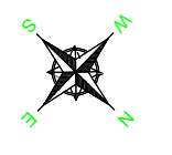
19 PLANTA BAIXA - LUMINOTÉCNICO ESCALA: 1/100